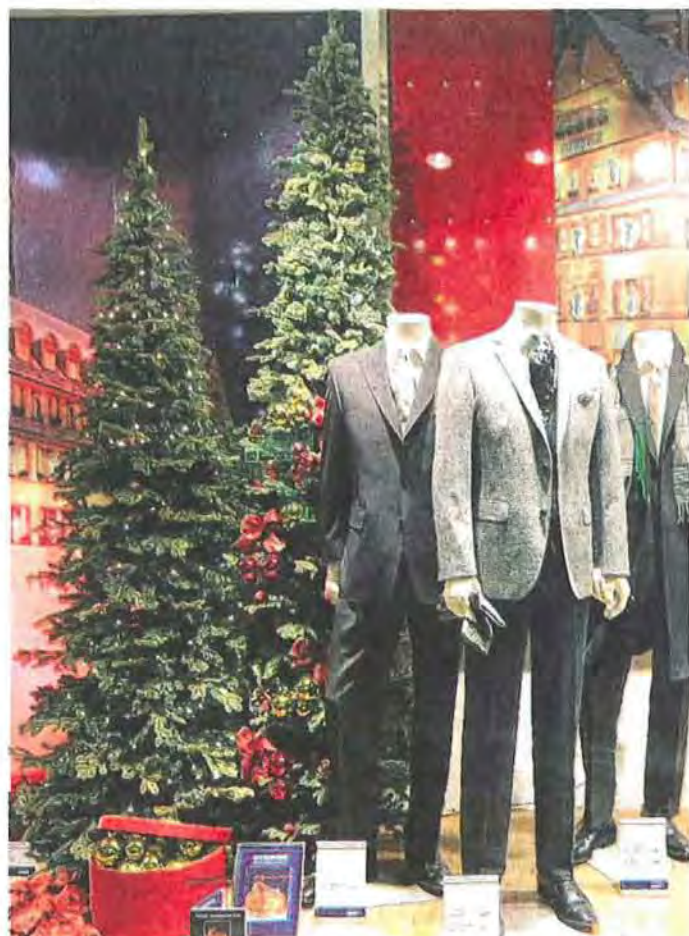
Gleich mehrere Christbäume haben die Kreativen von Hirmer im Schaufenster aufgebaut, dazu gibt's festliche Garderobe für Herren, passend zum Fest.