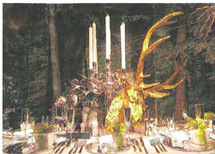
Ein goldener Hirschkopf, dazu versilberte Tannenzapfen und ein edler Leuchter: So sieht der Dekorateur vom Oberpollinger den perfekt gedeckten Tisch fürs weihnachtliche Festmahl.

Lassen Sie sich inspirieren! Beim Bummeln in der City