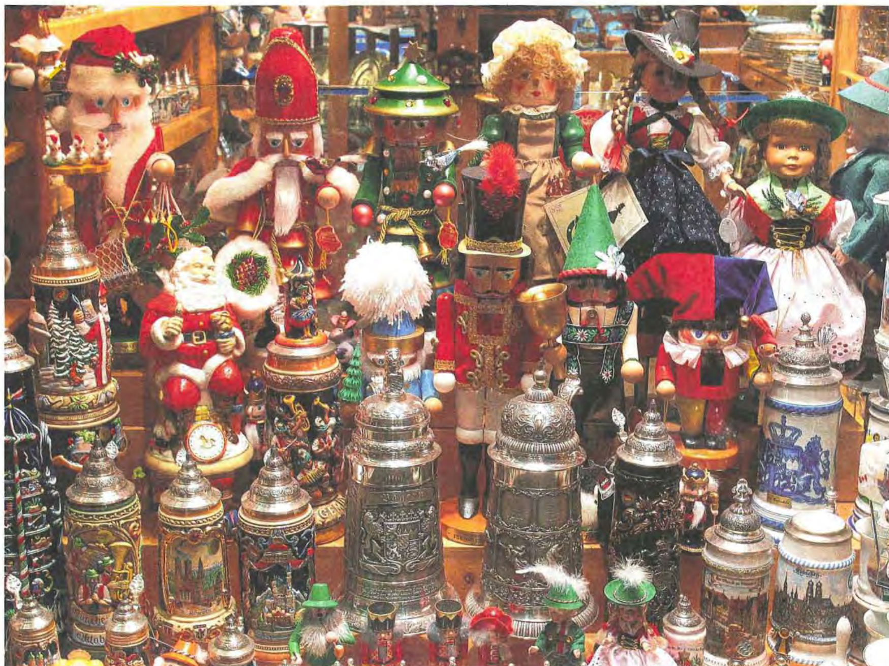
Zinnkrüge mit München-Motiven, traditionelle Nussknacker und Trachten-Puppen gibt's bei Max Krug in der Neuhauser Straße.