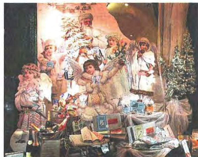
Warm eingepackt, mit Muffs und Mützen, bringen diese Engel Delikatessen und Champagner für den kulinarischen Höhepunkt an Heiligabend. Wenn Dallmayr sie aus dem Schaufenster lässt.