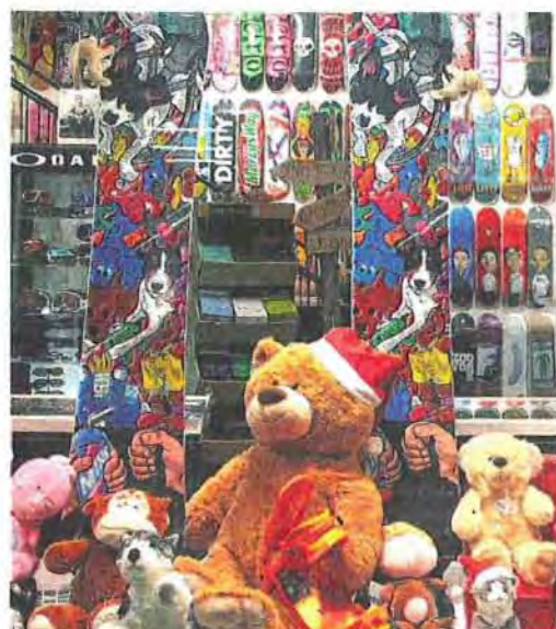
Völlig klar: Der Weihnachtsmann ist eigentlich ein Teddy-Bär und fährt Snowboard - zumindest bei Planet Sports im Zentrum.