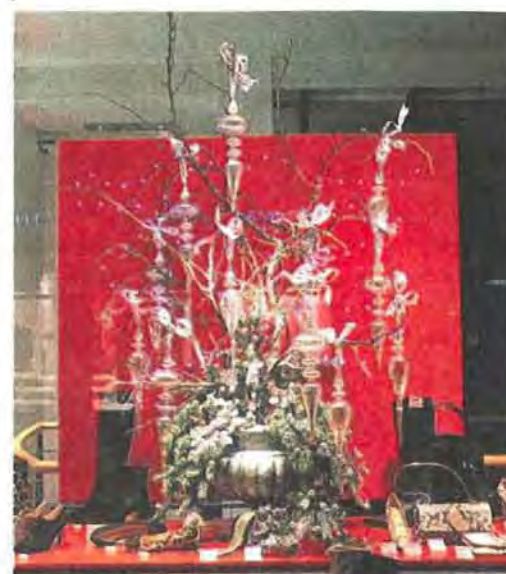
Bartu setzt auf Kristall-Zapfen statt Kugeln, zarte Äste und eine üppige Silbervase. Und natürlich auf Schuhe, Schuhe, nochmal Schuhe - und Taschen.