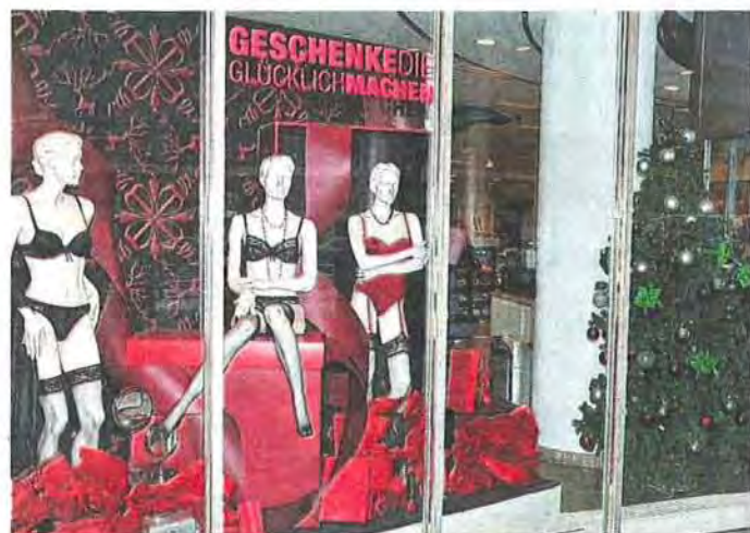
Diese Geschenke hat doch schon jemand heimlich ausgepackt... Galeria Kaufhof am Stachus stellt einen Weihnachtsbaum aus und sexy Dessous - die Interpretation überlassen wir Ihrer Fantasie.