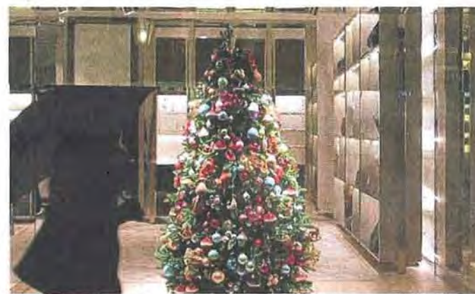
Ein einziger Tannenbaum, dafür üppig geschmückt: So sieht Weihnachten bei Dolce & Gabbana in der Maximilianstraße aus. Ob die Passantin mit dem Regenschirm gleich stehen bleibt?

Sollten Sie jetzt immer noch nicht wissen, was in Ihrem ganz speziellen Fall das passende Präsent ist, lassen Sie sich doch einfach von Münchens schönsten Schaufenstern inspirieren... AZ