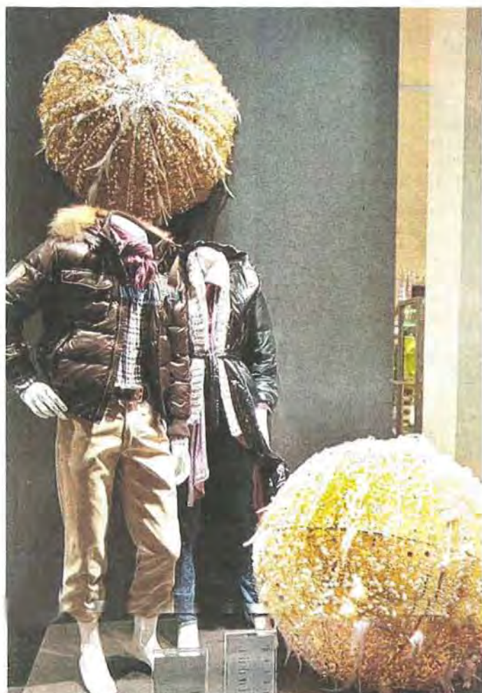
Riesige golden-funkelnde Schneebälle kullern bei Koen durch die Auslagen, in denen Schaufensterpuppen zeigen, mit welchen Kleidungsstücken man sich vor der Advents-Kälte schützen könnte.